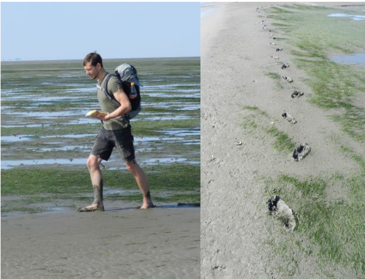
Abb. 3: Seegraskartierer mit GPS-Gerät bei der Arbeit (A). Die Grenzen der > 5 %- und > 20 %-Bedeckung werden zu Fuß eingemessen (B).

Auch die Verteilung der Seegrasarten innerhalb der Bestände wird auf diese Weise aus den Aufnahmepunkten bestimmt, wobei Zostera noltii , Zostera marina und Mischbestände (Mixed Zostera ) unterschieden werden. Für die Einordnung einer Seegraswiese wird ein Anteil einer Art von 5 % oder eines Mischbestandes von > 10 % als ökologisch relevante Beteiligung an der Bildung des Bestandes bewertet (Dolch et al. 2010 , 2015 ).